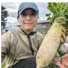
私はふれあい農園で野菜作り

制度設計には、農協や農家等、農業関係者の方々のご意見を聞きながら進めていくとのことでした。